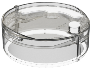
RF + AM disponible